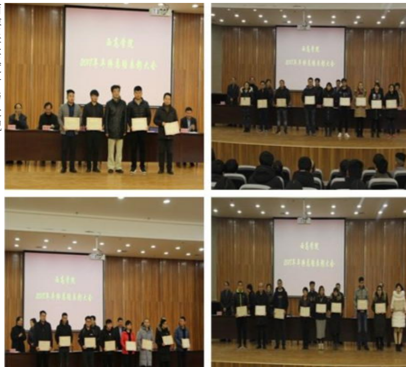
( 荣 获 年 度 奖 的 教 职 员 工 代 表 )

2018年是我院历史性跨越的一年,2019年学院将完成新校区二期建设,大型图文中心、大型实验室、工程训练中心都将投入使用,学院将继续深化教改,强化机械、会计、网络等一流专业建设力度,凝练特色,提升人才培养质量。学院的精细化管理、口碑工程建设和标志性成果建设也将进一步落到实处,智慧化产学研一体化泾河新校区将引领学院向国际化大学标准迈进。2019年,望全体西高人满怀憧憬、矢志教育锲而不舍,团结一致,在智慧化泾河新校区,共同创造美好的明天。