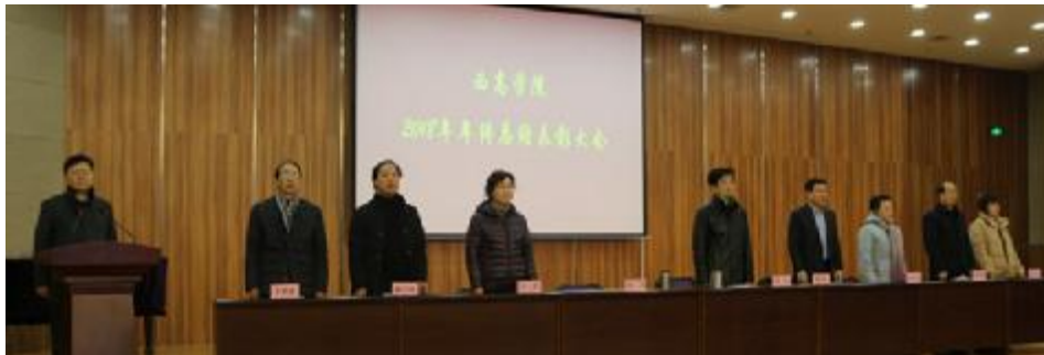
( 2018 年 终 总 结 暨 表 彰 大 会 现 场 )

回顾过去的2018年,是学院深化改革、强化内涵发展的一年,学院在上级教育行政部门及各级政府的领导下、在西安理工大学的大力协作与支持下,全院师生员工凝心聚力,克服困难,入驻泾河新校区,完成了既定的工作任务,创造了许多新的业绩。