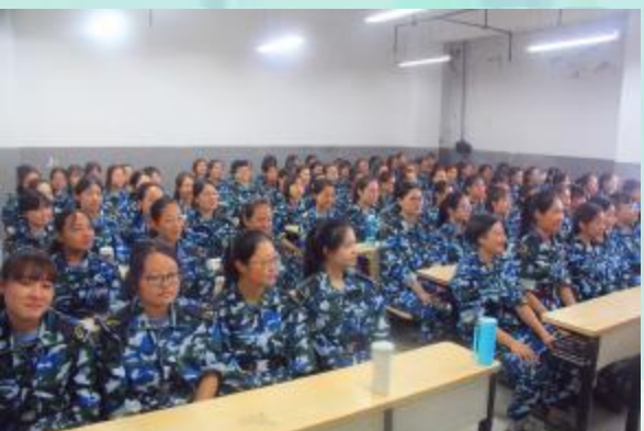
优秀的表演需要更优秀的观众, 好巧我们就是