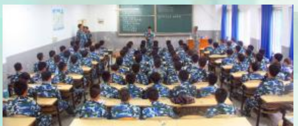
不管是军训还是拉歌, 我们都是这么认真