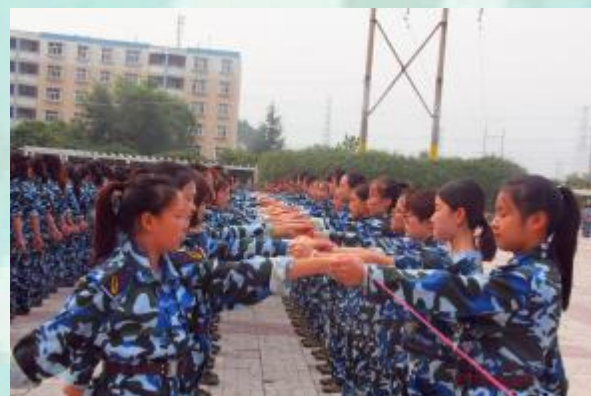
其实, 女生也不赖的