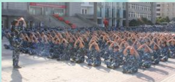
手语我们也能够很厉害