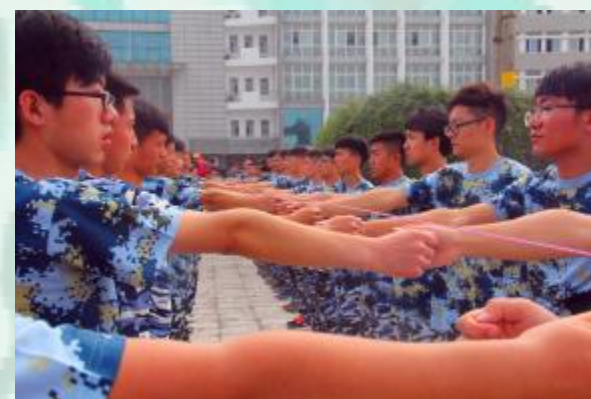
所以说, 认真训练的男生最帅了