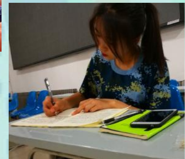
最后, 附送我们可爱的小记者照片一张