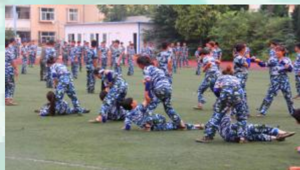
好天气当然配摔擒了