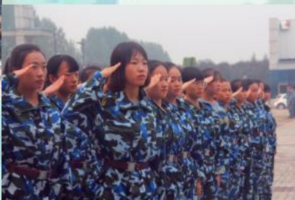
巾帼不让须眉, 谁说女子不如男