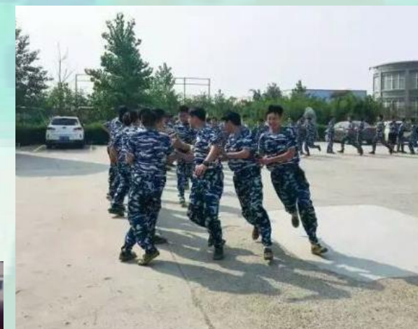
为了训练也是操碎了心