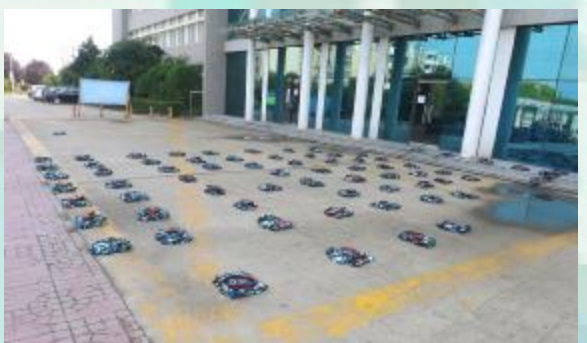
所谓小事看细节, 嗯...我们只是很自然的随手一放罢了

· 当你们踏入大学的大门时你会发现大学生活并不像高中想的那么轻松, 同样需要努力, 需要奋斗, 需要规划自己的人生。 · 才华是刃, 辛苦是石。锋利的刀, 就需要刃在石上千锤百炼。 · 大学里时间比较充裕, 但时间易逝, 没有规划的人生不会有精彩的片刻。 · 认知。认知能力的获取, 是未来社会生存的一项基本职能。