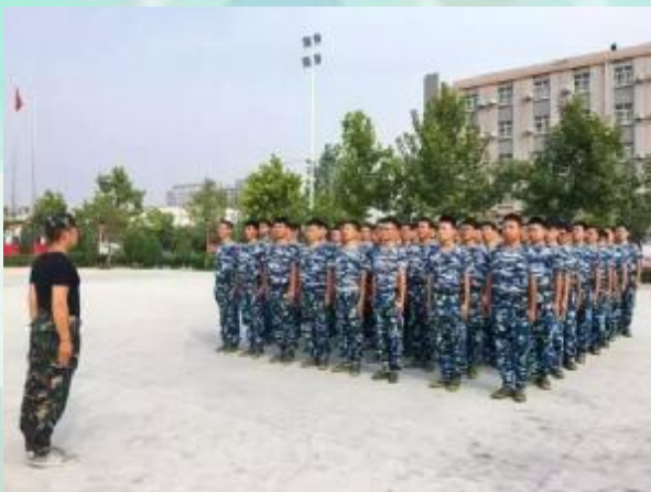
我们是新生, 但是我们站得整齐站得直

·吃得苦中苦, 方为人上人。狠毒的太阳锻炼出你们钢铁般的毅力, 繁重的训练磨砺出你们一招一式的阳刚, 这就是付出与回报的必然。军人必备的是军姿和军魂, 而我们则需要的是学习精神和学习态度。希望能在我们的大学校园里看到你们成功, 努力, 优秀, 上进!