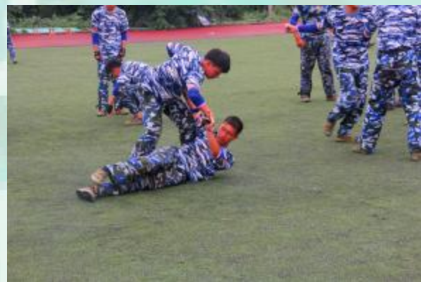
刚下过雨? 不存在的, 我们心里只有训练

·吃得苦中苦, 方为人上人。狠毒的太阳锻炼出你们钢铁般的毅力, 繁重的训练磨砺出你们一招一式的阳刚, 这就是付出与回报的必然。军人必备的是军姿和军魂, 而我们则需要的是学习精神和学习态度。希望能在我们的大学校园里看到你们成功, 努力, 优秀, 上进!