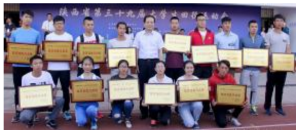
我院荣获陕西省第三十九届大学生田径运动会“体育道德风尚奖”

院的参赛项目有男子100米、200米、400米、800米、1500米、5000米、4×100米接力、跳远。运动员们作风顽强,组织纪律观念强,比赛目的端正,勇于进取,奋力拼搏,比赛成绩优良,体现了新时期运动员良好的体育道德风尚。