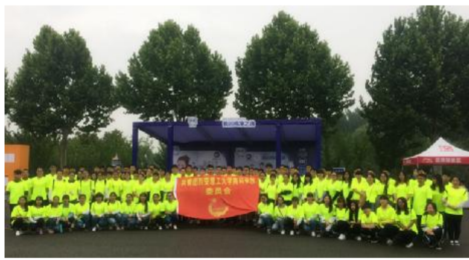
高科学院青年志愿者协会