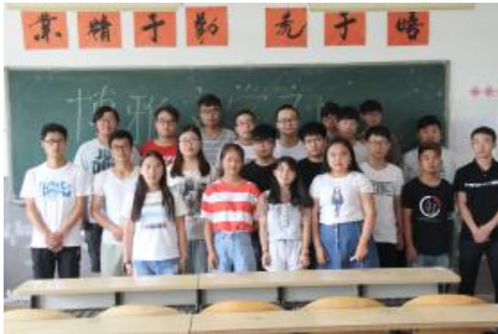
参加人员集体合影

大会首先由文学社指导老师马哲老师讲话,她充分肯定了社团在丰富学院文化中作出的贡献,文学社是一个富有自身特色的社团,团结了广大文学爱好者,不仅可以提升自己的文学素养,而且丰富了自己的课余活动。在文学社,要求儒雅但不能迂腐,博学但不能炫耀,平淡但不能无为,要求大家团结一心,有百家争鸣的精神,文学社才会发展的越来越好。下面由本届文学社社长黄蕾发言,她总结了过去一年来社团