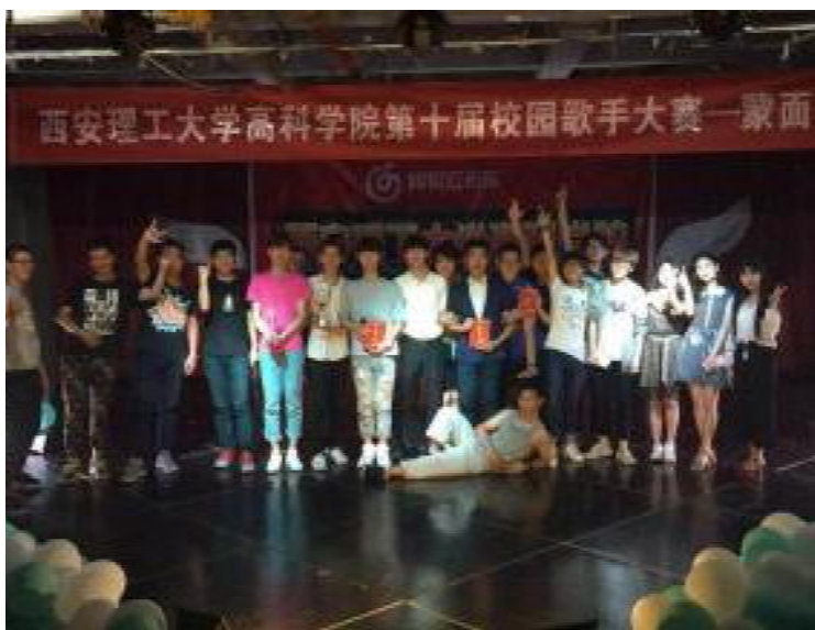
参赛选手与工作人员合影留念

音符在跳动,歌声在蔓延,本次歌手大赛的成功举办,不仅展示了我院学生的青春风采,也为他们提供了一个展示自我和发挥才能的舞台。动听的旋律还在耳边萦绕,怀揣着对音乐的热爱,让我们期待有更多的同学能够展示自己,用歌声点亮人生。我院第十届校园歌手大赛——蒙面歌王在一片欢呼与掌声中完美落幕。