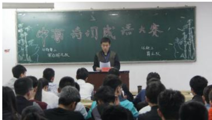
诗词成语大会火热进行中

此次大赛亮点纷呈,不仅展示了同学们的文化底蕴,而且更加深刻的让大家感受到了中国诗词成语的魅力,激发同学们对诗词的热爱以及对中华民族光辉历史和灿烂文化的认同感。