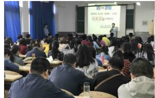
我院对全体参赛教师进行培训