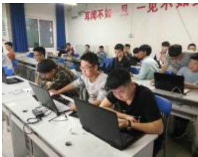
视觉大赛如火如荼进行中

学生工作室分为三个组,分别为视频组、平面组、网络组,共有13名选手参赛。大赛开始,在主持人宣读比赛流程和注意事项后,紧接