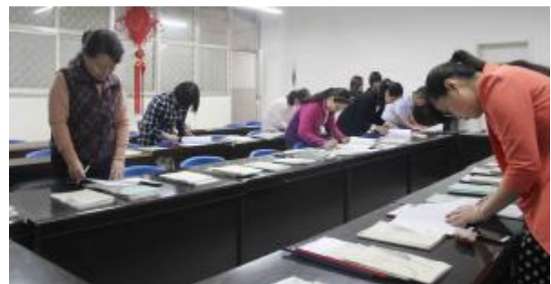
我院教师全面细致的检查评比教案

导骆光林教授、崔俊凯教授等及学生处、教务处、督导处教师逐一观摩展出的教案,对我院教师的教案进行了全面细致的检查评比,根据教案评比检查的标准,从教学目标、教学方法、教学内容、学时设计、教案规范五方面,对抽查展出44位教师的149份教案,进行了认真的检查和评分,并提出了宝贵的意见。