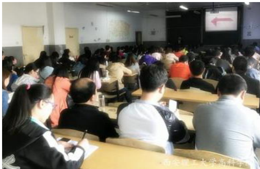
我院召开 2017 年“互联网+”大学生创新创业大赛培训会

据悉,本届大赛以“搏击‘互联网+’新时代,壮大创新创业生力军”为主题,采用与第二届相同的校级初赛、省级复赛、全国总决赛三级赛制,参赛对象为普通高等学校在校生(不含在职生)和毕业5年以内的毕业生。比赛项目主要包括“互联网+”现代农业、“互联网+”制造业、“互联网+”信息技术服务、“互联网+”文化创意服务、“互联网+”商务服务、“互联