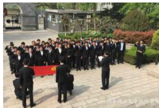
我院开展“一学一做”教育实践活动 宣传处 吕妍/摄

大学生的爱国主义情怀,践行社会主义核心价值观。“挥泪继承先烈志,誓将遗愿化宏图”烈士的英灵激励我们的大学生树立崇高的理想信念,继承先烈遗志,发扬革命精神,落实一学一做,争当有理想有担当、有作为、有修养的当代大学青年。树立正确的人生观、价值观、世界观,为实现中国梦而奋斗。(来源:宣传处 吕妍)