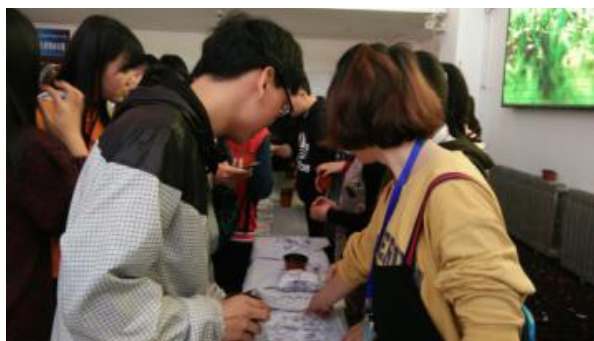
同学们积极参与绿植领养活动

活动开始前一周,部门成员便着手准备工作,在主楼大厅以及宿舍张贴宣传海报,号召全院同学参与,团委宣传部以及学生会宣传部利用板报完成本次活动的平面宣传,并进班宣传本次绿植活动。当日早十点,工作人员开始布置场地,在大厅摆好桌椅,搭起展板,张贴海报条幅。中午12时,绿植领养活动开始,